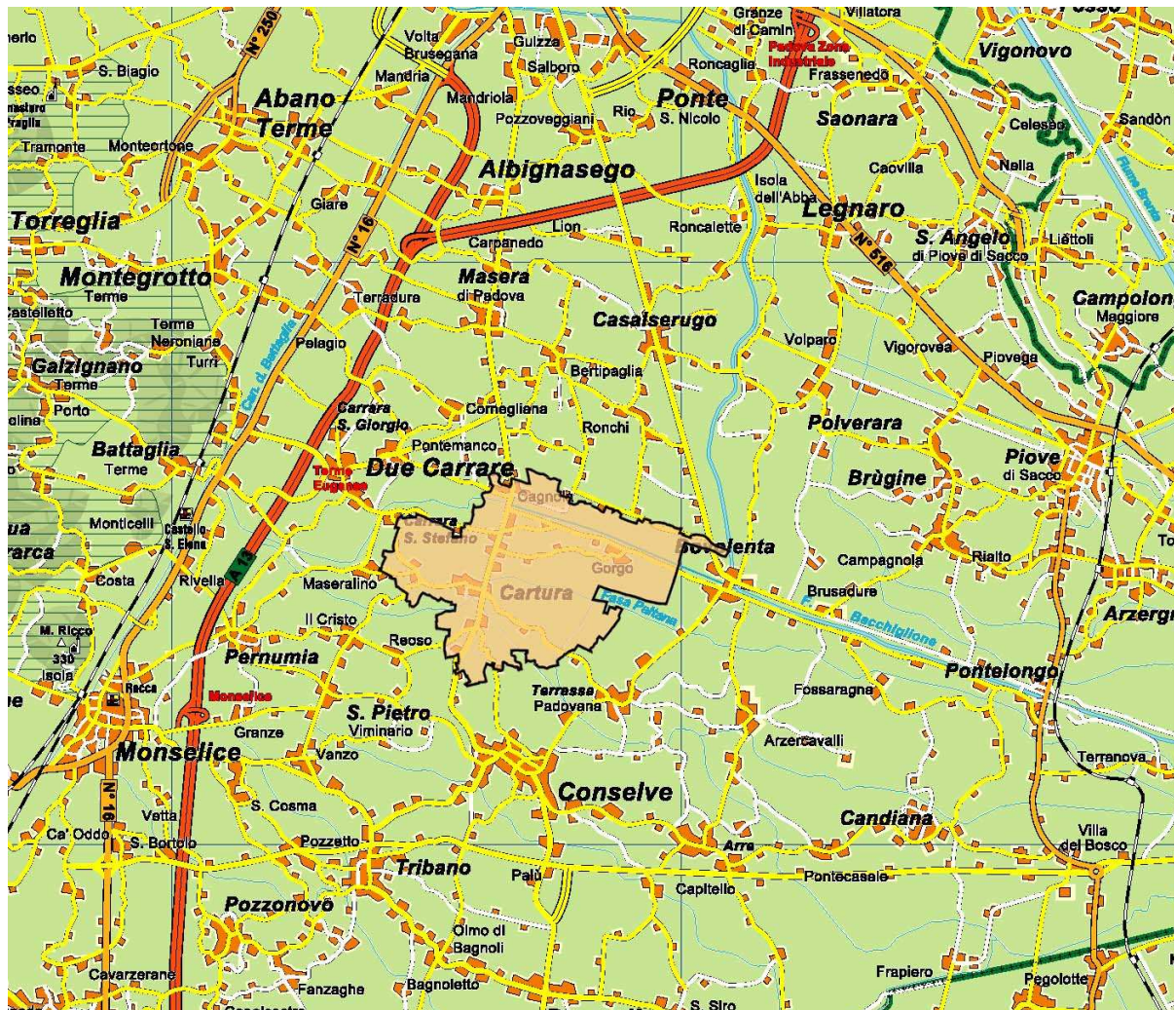
Figura 2: localizzazione del Comune di Cartura.

Il territorio comunale è stato suddiviso in tre Ambiti Territoriali Omogenei (A.T.O.); questo ha permesso di poter analizzare le caratteristiche fisiche e urbanistiche sia per la costruzione del quadro conoscitivo, sia per le valutazioni di tipo ambientale e progettuale. Si riportano in Figura 3 i confini degli ambiti.