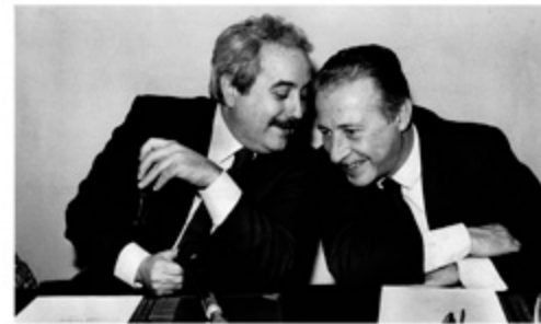
Gli uomini passano, le idee restano. Restano le loro tensioni morali e continueranno a camminare sulle gambe di altri uomini.