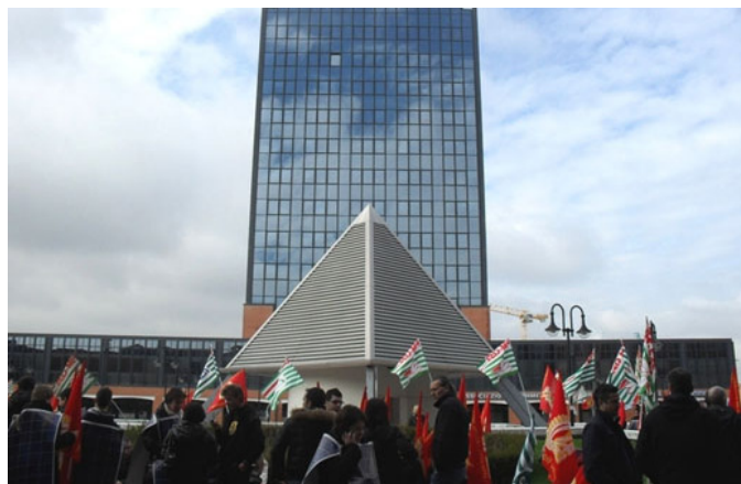
Manifestazione delle organizzazioni sindacali in Piazza Bardella a Padova