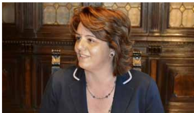
La presidente della Provincia di Padova Barbara Degani

Gli ingressi in disoccupazione tra gennaio e maggio rilevati dai Centri per l'Impiego padovani sono stati 11.802, con un andamento costante (+2%) in confronto ai primi cinque mesi del 2010. Ma la vera sfida per contenere