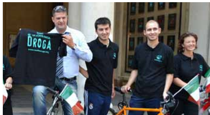
L'assessore provinciale all'Associazionismo Enrico Pavanetto con alcuni volontari dell'associazione "Dico no alla droga"

È partito da Piazza Antenore il tour ciclistico "Dico No alla droga". A dare il via alla carovana di corridori e volontari l'assessore provinciale all'Associazionismo Enrico Pavanetto. "Si tratta di un'importante iniziativa - ha detto l'assessore Pavanetto - che porta,