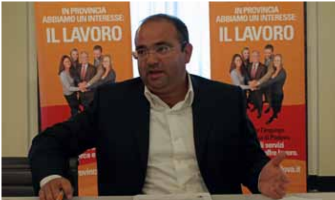
L'assessore provinciale al Lavoro Massimiliano Barison

Oltre 1.500 accessi giornalieri, 10mila persone e 400 aziende iscritte, 60mila operazioni svolte. Queste le cifre del Portale lavoro della Provincia di Padova a un anno dalla pubblicazione in rete. "In questo arco di tempo - ha detto l'assessore Massimiliano Barison - i risultati relativi all'utilizzo da parte delle persone e delle aziende hanno superato le nostre aspettative. Significativo è l'aumento del 40% delle offerte di lavoro nel primo semestre del 2011, rispetto lo stesso periodo del 2010, gestite direttamente dalla