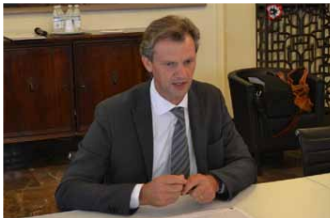
L'assessore provinciale all'Educazione stradale Gilberto Bonetto

L'Assessorato all'Educazione Stradale della Provincia di Padova in occasione delle partenze estive ha dato vita ad una nuova campagna di sensibilizzazione alla sicurezza stradale. L'Assessorato ha prodotto due spot, della durata di 15 secondi ciascuno, che andranno in onda sulle emittenti televisive locali quando, per tradizione, le strade e le autostrade sono più affollate: dal 20 luglio al 20 agosto. Alla presentazione della nuova campagna ha partecipato l'assessore provinciale all'Educazione stradale Gilberto Bonetto. "Per realizzare gli spot - ha spiegato Bonetto - abbiamo